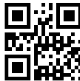
Тестовый QR код

При правильных настройках и подключении к контроллеру СКУД Gate в ПО Gate-Server-Terminal будет отображаться ключ: 123/45678